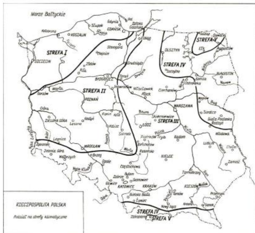
Rys.1. Podział Polski na strefy klimatyczne (załącznik krajowy NB do PN-EN 12831[48])

b) Polimeroasfalty powinny spełniać wymagania podane w tablicach 4a i 4b